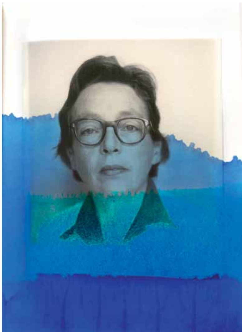
« Encre assassine », 2014 de Thu Van Tran Livre, bleu de méthylène. 26 x 42 cm (Détail) Portrait de Marguerite Duras issu de la collection Jean Mascolo

Exposition réalisée en coproduction avec l'IMEC