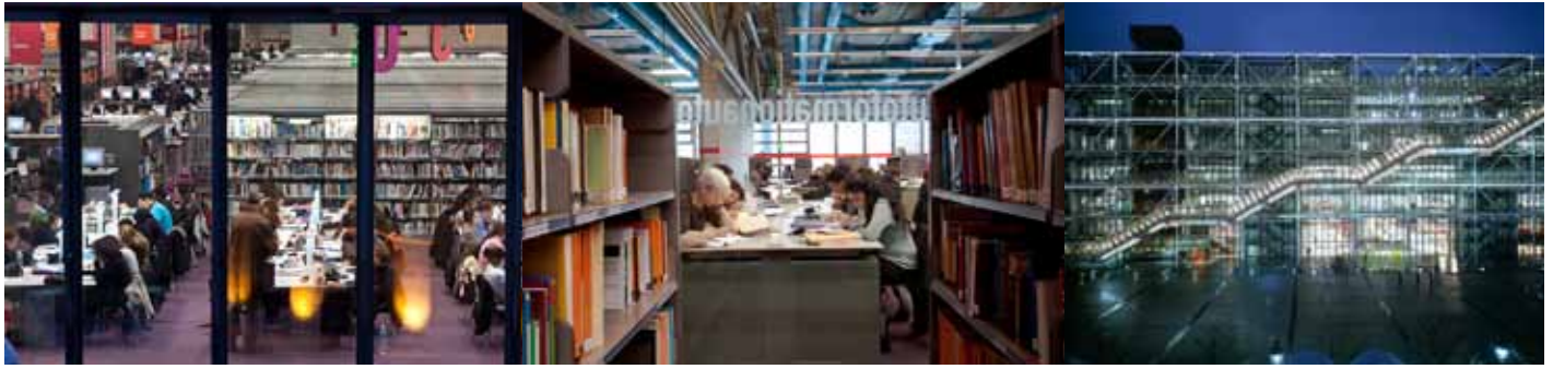
Bpi- Photographe Michael Levy © Bpi