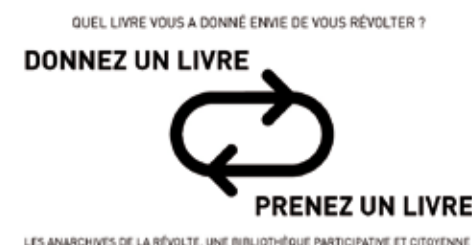
LES ANARCHIVES DE LA RÉVOLTE. UNE BIBLIOTHÈQUE PARTICIPATIVE ET CITOYENNE

Quel livre vous a donné envie de vous révolter ? Dans le cadre du festival Hors Pistes, la Bpi mettra une bibliothèque participative et citoyenne en place. Elle s'inscrira dans le processus artistique des Anarchives de la révolte, initié par WOS. Vous êtes invités à l'alimenter en déposant aux bureaux d'information le(s) livre(s) qui ont éveillé en vous le désir de révolte.