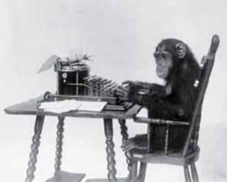
Chimpanzee seated at a typewriter, 1906

Les récents débats sur l'application de la réforme de l'orthographe de 1990 montrent combien le sujet de l'écriture fait l'objet de prises de positions passionnées en France. Entre les nostalgiques et les tenants d'une démocratisation de l'orthographe, les enjeux de distinction sociale sont forts. Les jeunes écrivent-ils vraiment moins et moins bien qu'avant ? Peut-on accepter l'évolution de l'écriture sans y voir un appauvrissement du langage ?