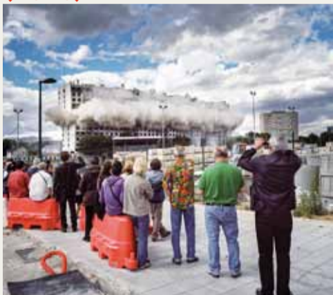
Asnières-sur-Seine, Démolition des Gentianes, 2011

Mercredi 13 avril • 19h • Entrée libre • Bpi • Espace presse • Niveau 2 • Entrée rue Saint-Martin (Piazza)