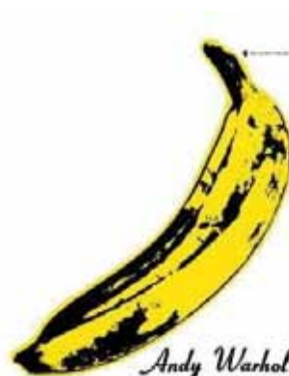
The Velvet Underground & Nico (1966) : distorsions pop

Samedi 9 avril • 18h • Entrée libre • Bpi • Salon Jeux vidéo • Niveau 1