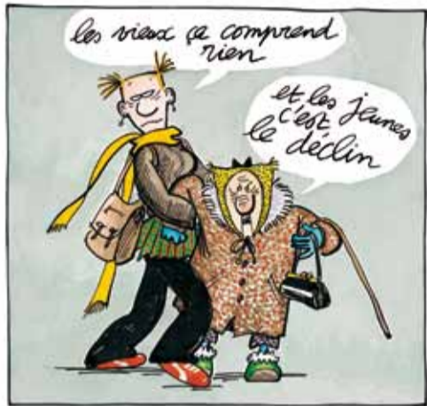
Agrippine et Zonzon © Claire Bretécher / Dargaud

Vendredi 1 er avril • de 14h à 21h30 • Entrée libre • Centre Pompidou • Petite Salle • Niveau -1 • Entrée rue Saint-Martin (Piazza)