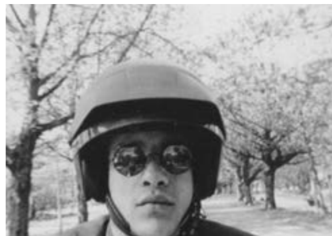
Amsterdam Global Village , 1996

Ce qui était frappant, c'était la manière qu'avait Johan van der Keuken d'être de plain-pied dans la réalité occidentale et d'avoir compris avant d'autres la crise sociale et morale qui secouait notre continent. Il avait surtout compris, vu et enregistré l'interaction entre cette crise occidentale et ses effets sur le reste du monde, son lien avec l'émergence d'autres pays, d'autres cultures et d'autres économies, en Asie, en Amérique latine et en Afrique. On ne parlait pas alors de la « mondialisation », mais lui avait déjà senti et pensé les effets « Monde ». Il s'y était intéressé parce qu'il était un cinéaste-voyageur, un excellent « regardeur », témoin du monde dans lequel il vivait. Son œuvre est donc résolument contemporaine. On ne dira jamais assez à quel point Johan van der Keuken a vu et capté, tel un sismographe, avant d'autres, les soubresauts qui agitent le monde depuis un demi-siècle. Il a vu parce qu'il savait, de manière à la fois instinctive et réfléchie, regarder le monde et les êtres humains, de manière juste et sensible.