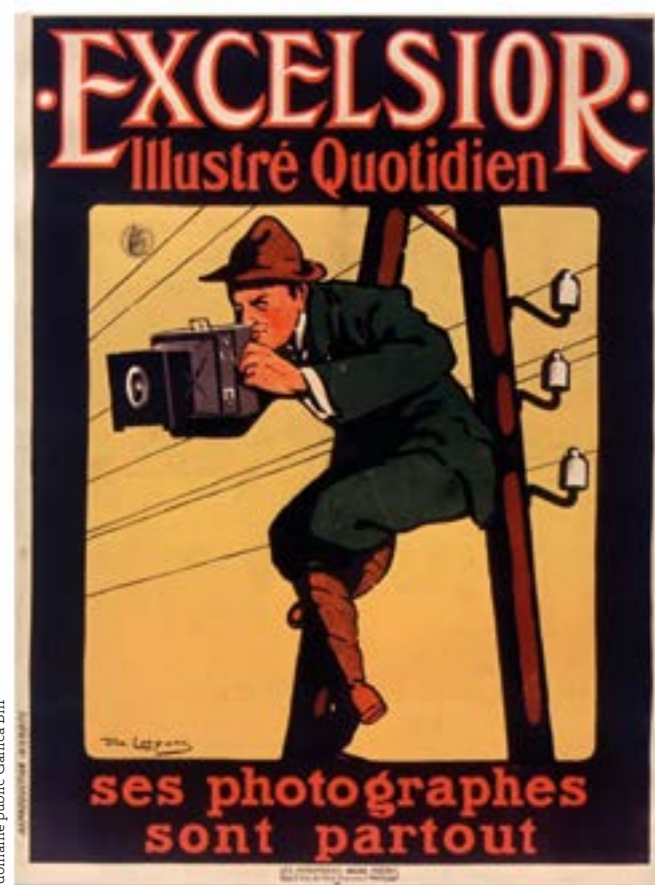
Affiche de Daniel de Losques pour Excelsior .

Professeur à l'université Paris-Nanterre