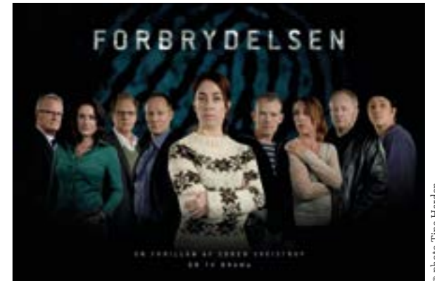
The Killing (Forbrydelsen) , série danoise de Søren Sveistrup

Global TV series : Cap au Nord ! Journée d'étude Lundi 15 janvier à partir de 14 h Petite Salle