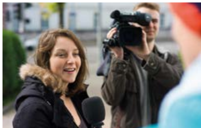
Élèves journalistes en reportage