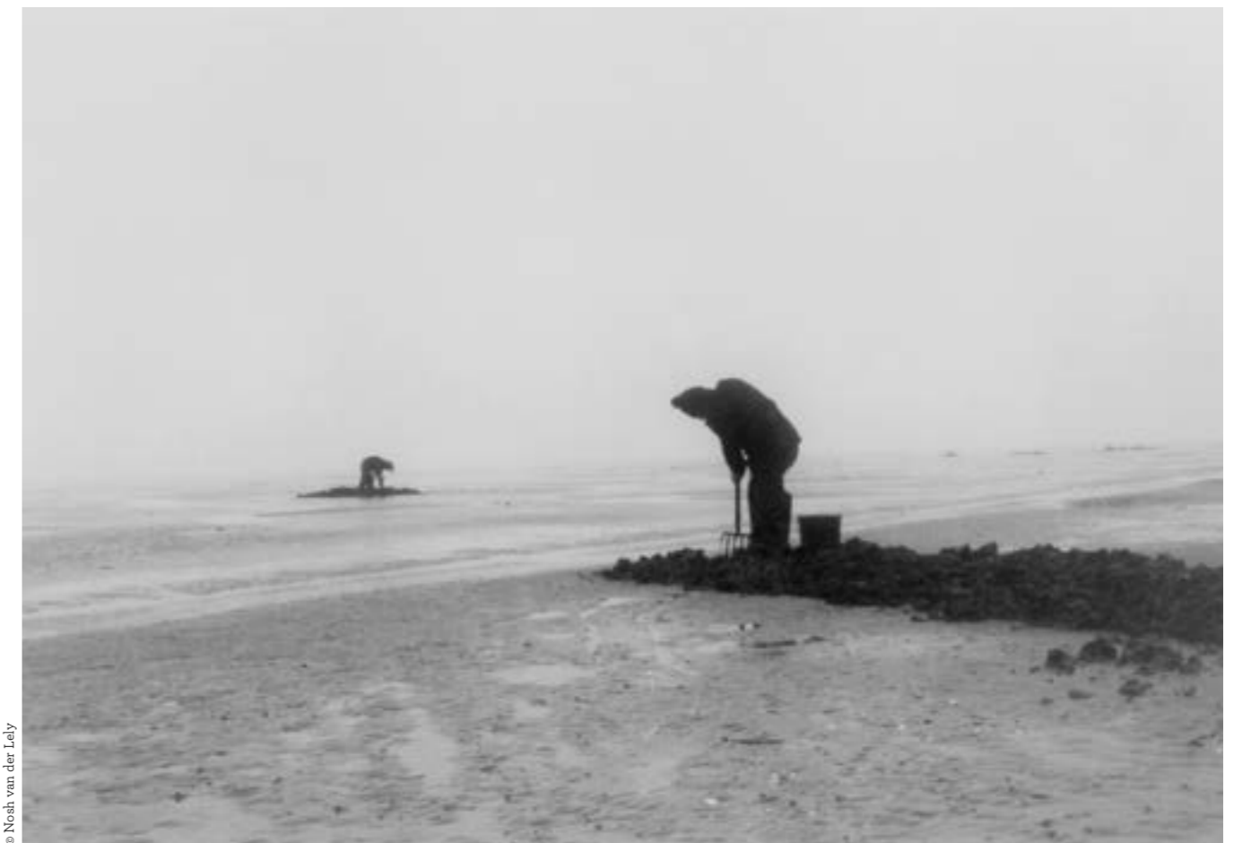
La Jungle plate , 1978

Plusieurs de ses films me touchent beaucoup. J'adore L'Enfant aveugle , un film dicté et rythmé par cet adolescent de quatorze ans, aveugle, que Johan van der Keuken filme et suit avec grâce et dont il enregistre la manière de vivre, de sentir, de voir le monde à travers l'ouïe et le corps. J'aime tout particulièrement Amsterdam Global Village , un film sur lequel j'avais écrit un texte dans les Cahiers du cinéma , suivi d'un long entretien avec le réalisateur : « Amsterdam Global Village est d'abord un magnifique film de voyage. Johan van der Keuken laisse dériver son regard à la surface du monde. De sa ville d'Amsterdam, il épouse le mouvement, les flux visibles et secrets. Le mouvement du film sera donc circulaire et latéral, tour à tour fondé sur des travellings, au fil des canaux ou des rues et sur des cercles de plus en plus larges, qui finissent par donner un sentiment du monde. » En dehors du cinéma, Johan van der Keuken était aussi passionné par la photographie et le jazz. C'était un artiste complet.