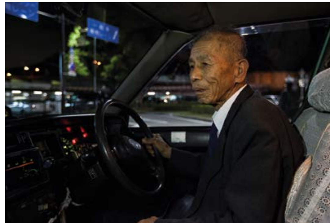
Au Japon, le travail se généralise parmi les personnes âgées de plus de 65 ans