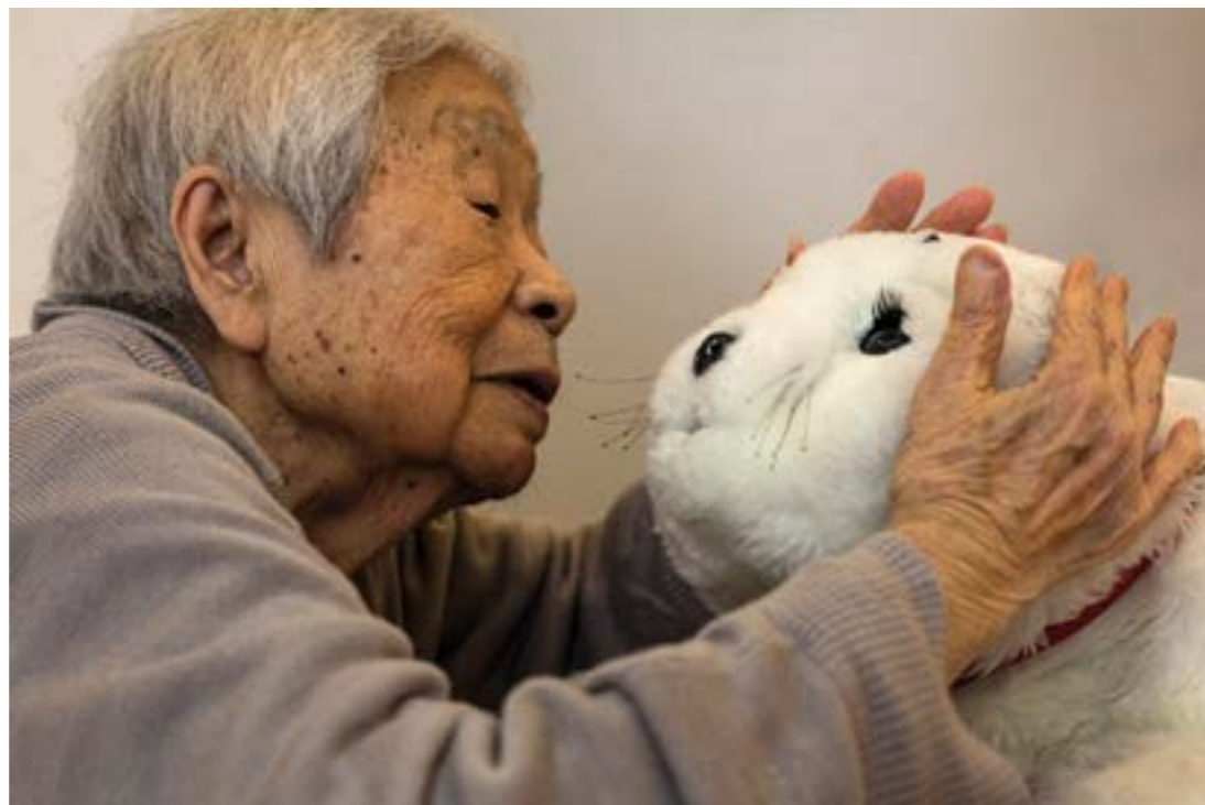
Séance de thérapie relationnelle avec le robot Smiby

C'est en voyageant et pour voyager que Pascal Meunier est devenu photographe. Esthétiques ou informatives, ses photographies sont publiées dans des magazines français et étrangers ( Géo , 6 Mois , The Guardian ...). Le plus souvent, c'est lui qui propose un sujet à une ou plusieurs rédactions. Il nous raconte l'un de ses derniers reportages, consacré à la situation des personnes âgées au Japon.