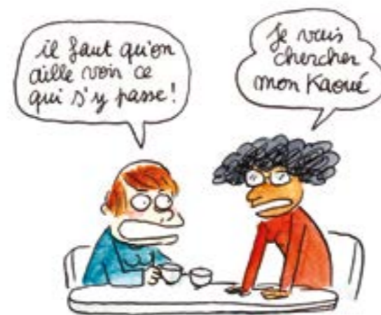
Les Nouvelles de la jungle de Calais de Lisa Mandel et Yasmine Bouagga, Casterman (Sociorama), 2017