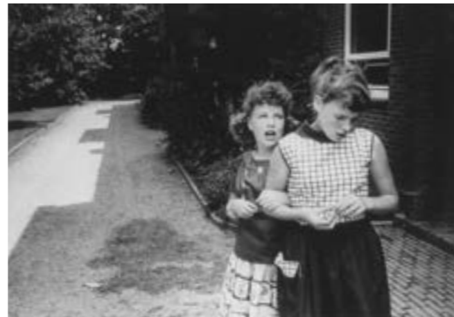
L'Enfant aveugle , 1964