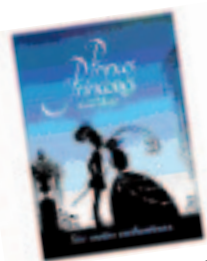
Princes et princesses