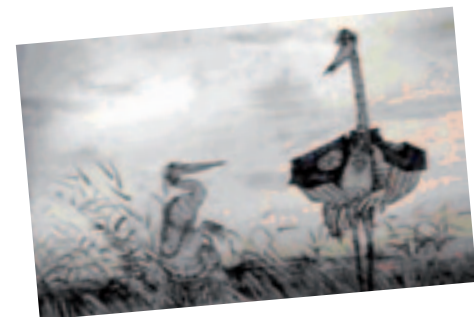
Le Héron et la cigogne