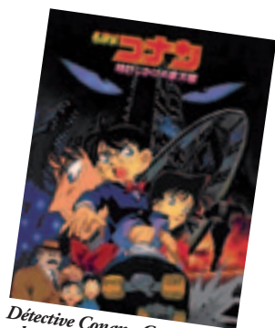
Détective Conan - Compte à rebours dans un gratte-ciel

(Accès sans réservation sur la plupart des postes multimédia des niveaux 2 et 3)