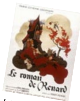
Le Roman de Renard