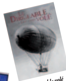
Le Dirigeable volé