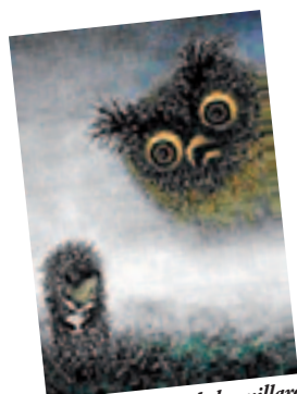
Le Hérisson dans le brouillard

Des histoires d'animaux par Ladislav Starevitch, le créateur des marionnettes animées (court métrage)