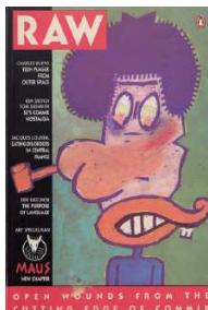
RAW, 1989 © Art Spiegelman