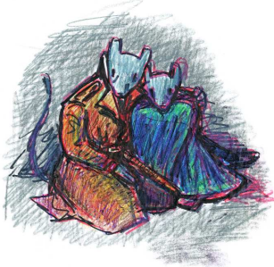
Esquisse pour la couverture du tome 1 de Maus, 1986. © Art Spiegelman

• Catalogue de l'exposition CO-MIX, contenant de très nombreux documents inédits avec des archives de l'artiste 30€, broché-cartonné, 340/240 mn- Flammarion 2012