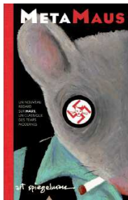
MetaMaus, 2012 © Art Spiegelman