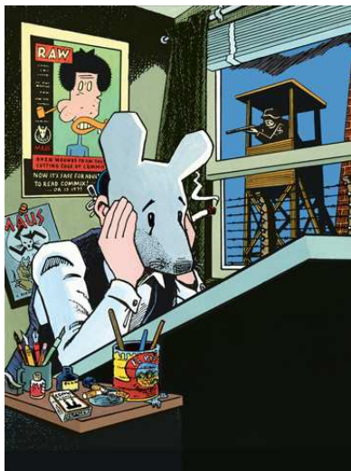
Self-Portrait with Maus Mask, 1989 © Art Spiegelman