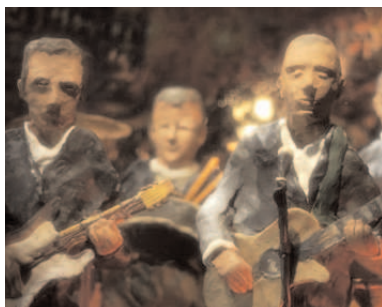
Jam Session

Samedi 29 octobre • 20h • Cinéma 2 • Durée totale de la séance 81'