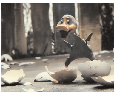
Le Vilain Petit Canard

LE VILAIN PETIT CANARD (Gadkii utenok) de Garri Bardine / Russie / 2010 / 72'