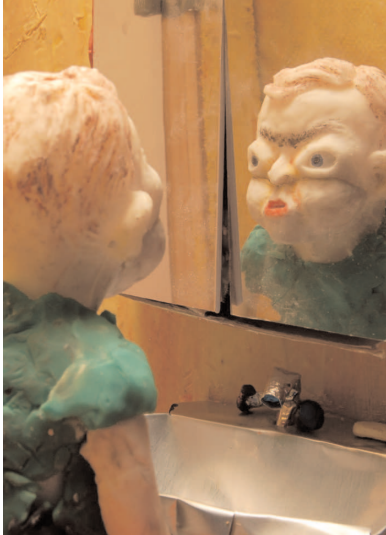
The Tale of Little Puppetboy