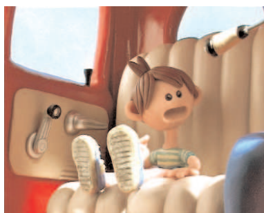
Viaje a Marte © JPZudio

LE PETIT PRINCE de Will Vinton / États-Unis / 1979 / 27'