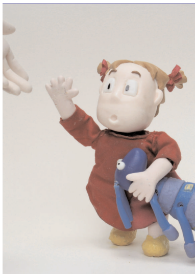
Premier voyage