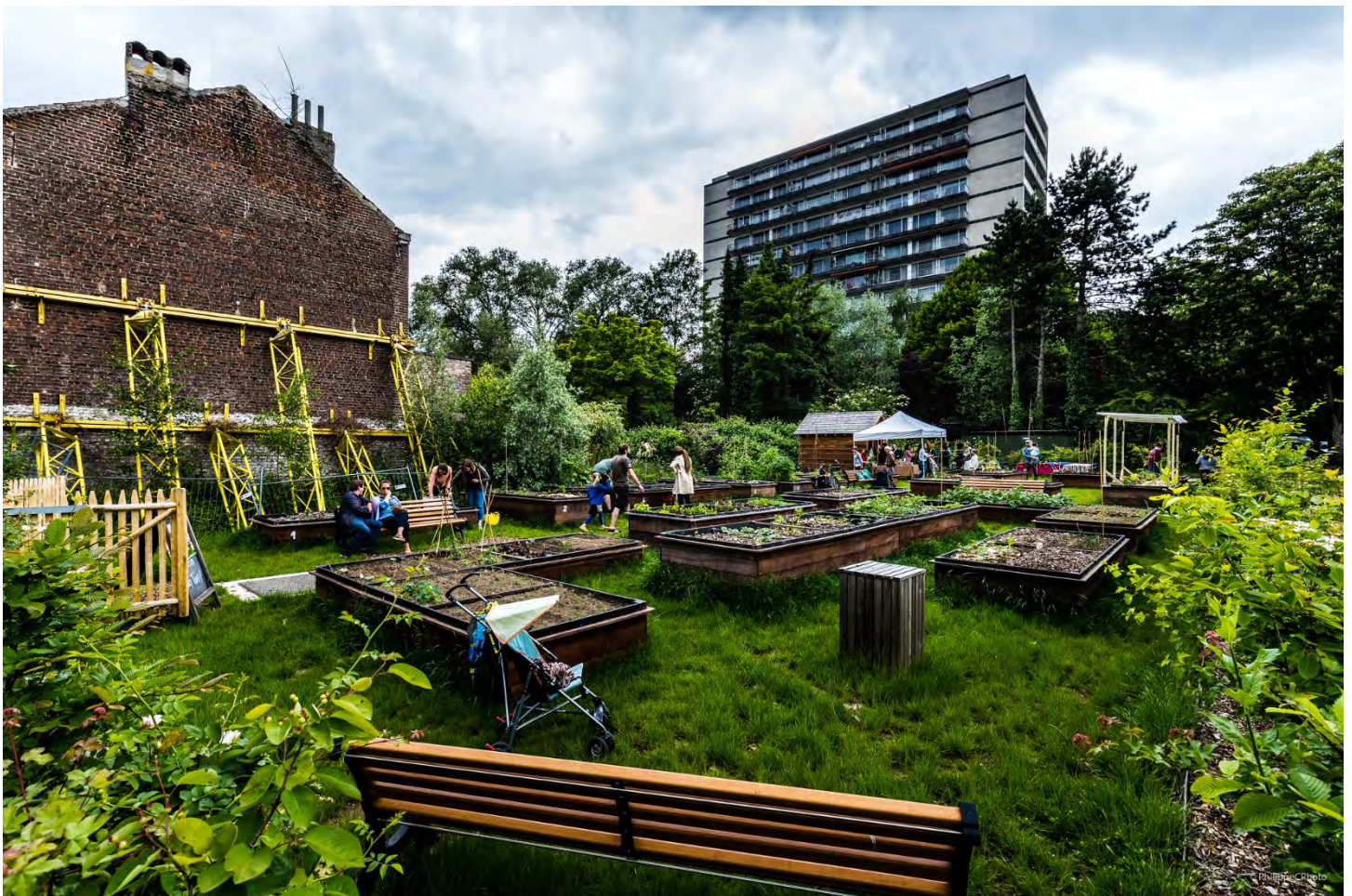
Potager urbain _ #PhilippecPhoto

Le Service Savoirs Pratiques vous propose une bibliographie actualisée à l'occasion de la sélection d'ouvrages sur les biens communs à consulter dans la bibliothèque du 19 mai au 15 juillet 2021.