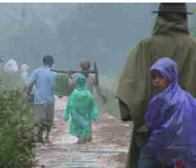
Jours de pluie

La plateforme Les yeux doc diffuse un catalogue de films témoignant de la remarquable diversité du cinéma documentaire ( www.lesyeuxdoc.fr ).