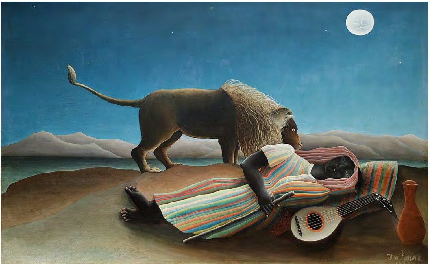
La bohémienne endormie, Le Douanier Rousseau, 1897, Museum of Modern Art, New York, CCBy Domaine Public

Du 18 avril au 29 mai 2023, la Bpi vous propose une sélection de ressources sur l'interprétation des rêves.