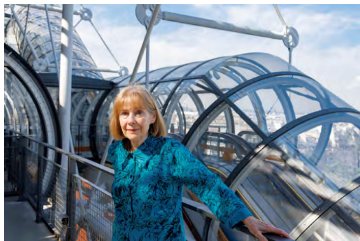
Posy Simmonds au Centre Pompidou en juin 2023

2022 Posy Simmonds reçoit, à la suite de nombreuses récompenses internationales, le Grand prix Töpffer de la bande dessinée.