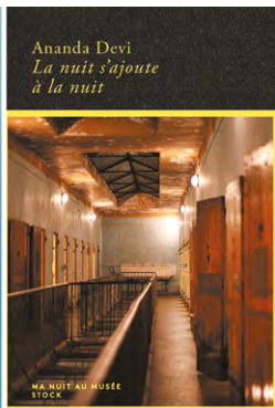
Portrait Ananda Devi / Couverture