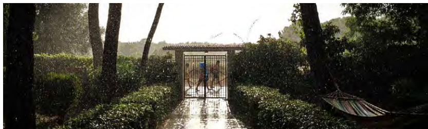
America © La Luna Productions

Tous les vendredis à midi, le cinéma de la Bpi, c'est gratuit !