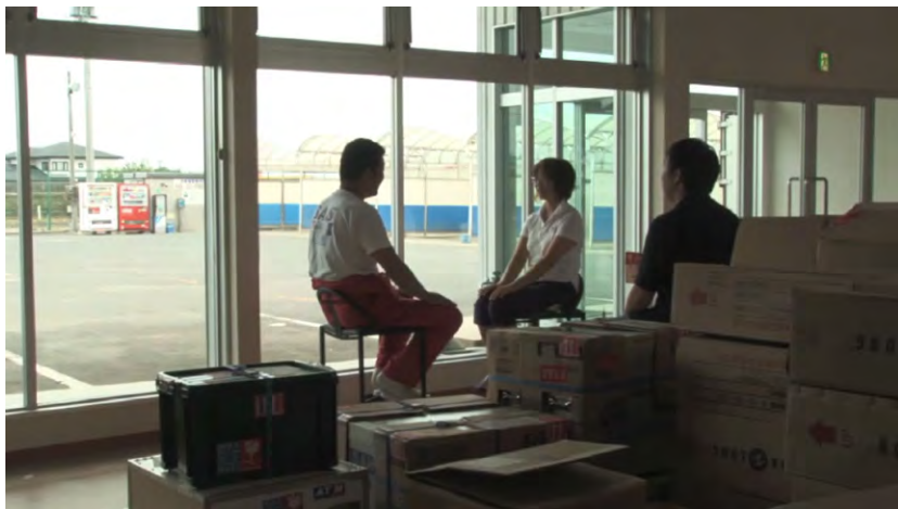
The Sound of Waves © Ryusuke Hamaguchi / Ko Sakai / Silent Voice