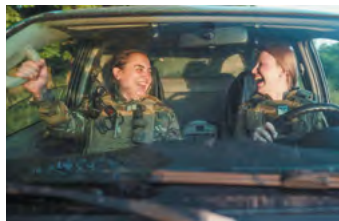
Cuba & Alaska

Aux quatre coins du pays, parfois loin de la ligne de front, les Ukrainien·nes enterrent leurs modèles et prennent leurs destins en main.