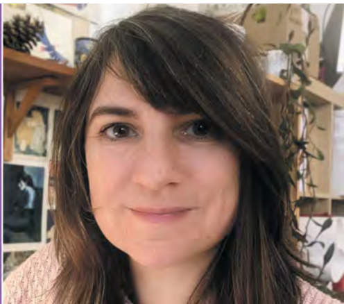
Couverture © Actes Sud - Portrait © DR

Jeudi 5 février • 19h-21h Espace Nouvelle Génération • Niveau 2 Et en direct sur Twitch Bpi_Pompidou